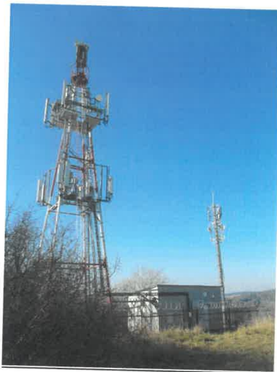
Zał. nr 1: Widok oglny instalacji radiokomunikacyjnej.

Koniec sprawozdania. Sprawozdanie zawiera dodatkowo załczniki nr 1 i 2.